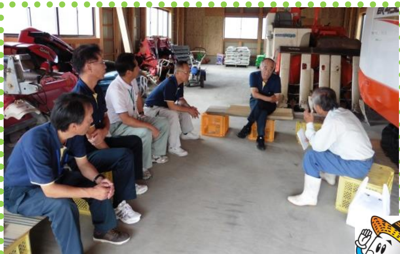
生産者⑥と宮田組合長（⑥から2人目）ら